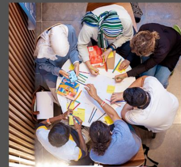
Γαλλία: ΨΔ για τον COVID-19. Άτομα ΕΕΑΚ και ΨΔ κατά τη διάρκεια της Πανδημίας COVID-19 (UP)