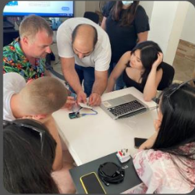
Κύπρος: Οι δήμοι ως χώροι δημιουργίας για μειονεκτούσες ομάδες (CIP)