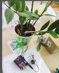
Κύπρος: Οι Σχολές ΕΕΚ ως χώροι δημιουργίας για μειονεκτούσες ομάδες. άτομα ΕΑΕΚ & άτομα που εγκαταλείπουν πρόωρα το σχολείο (CIP)