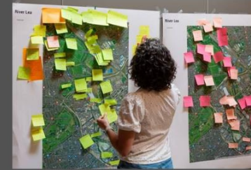
ΗΒ: Εκδήλωση συν-δημιουργίας και Επιστήμης των Πολιτών με κοινότητες στο Ανατολικό Λονδίνο. Ομάδες Δράσης για την Προστασία του Ποταμού Lea (UCL)